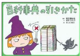
「百科事典の引きかた」 (埼玉福祉会)