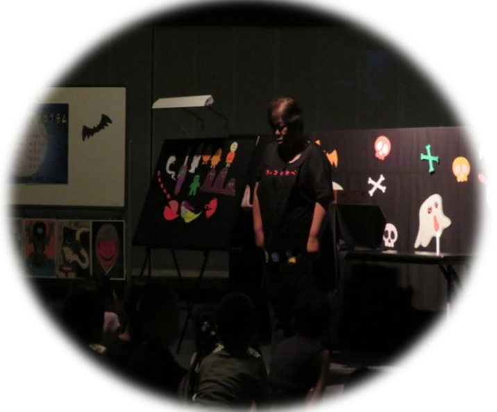
“語り” やはり、こわさ100倍です。