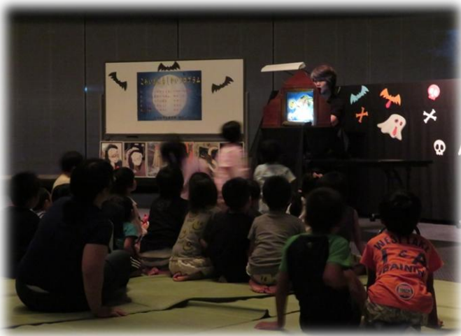
こわいけど、でもよ〜く見てみたい！