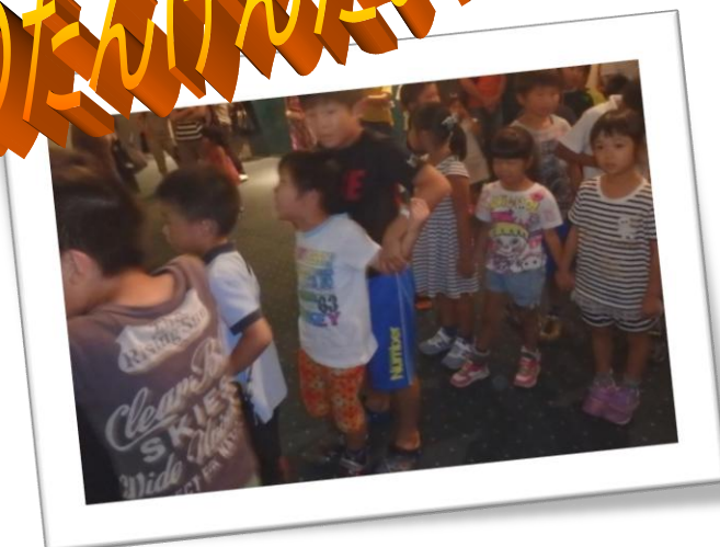
夜のとしょかん、どんなかな？まってるあいだもドキドキ！