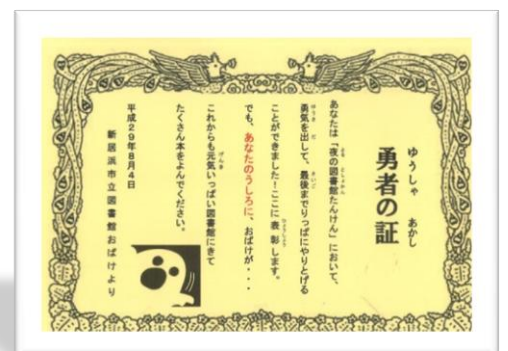
たんけんをおえてもらったよ！