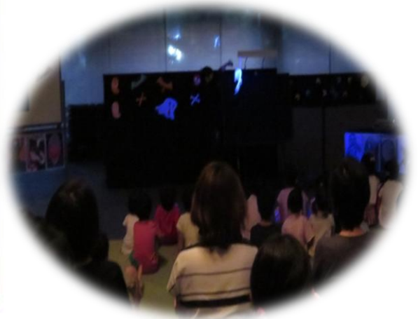
あやしい光の中に何かが・・・ “ひと〜つ、ふた〜つ”